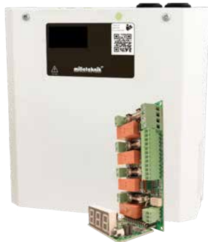
Fire module 4 outputs S