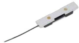
DIN module holder