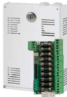
10 output module Mini